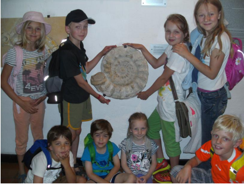
Jura Montessori Schüler zu Besuch im Jura Museum in Eichstätt