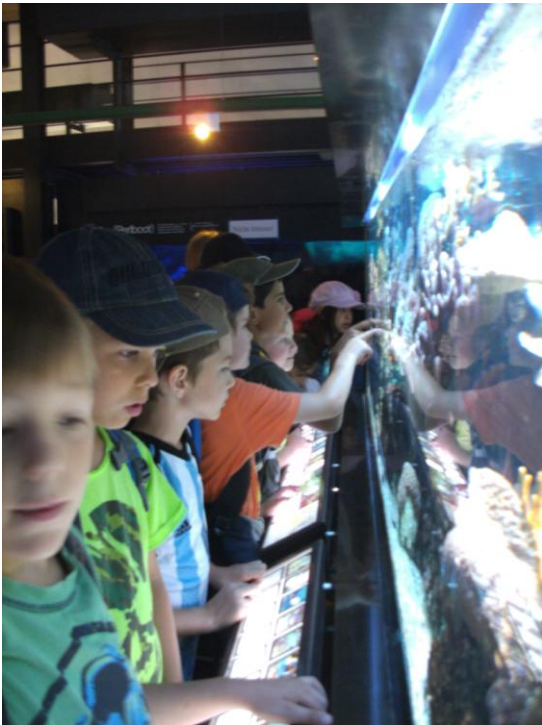
Futterführung im Aquarium