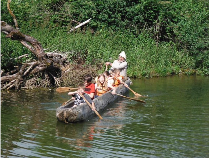
Fahrt mit dem Einbaum