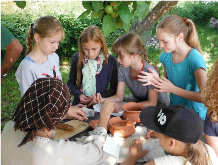
Herstellung von Ketten

Unser Dank gilt den Organisatoren des Ausflugs und Alcmona - Förderverein vorgeschichtliches Erlebnisdorf Dietfurt Landkreis Neumarkt/Opf. e.V. und natürlich den Kindern und den Eltern, die dieses Erlebnis mitgetragen haben.