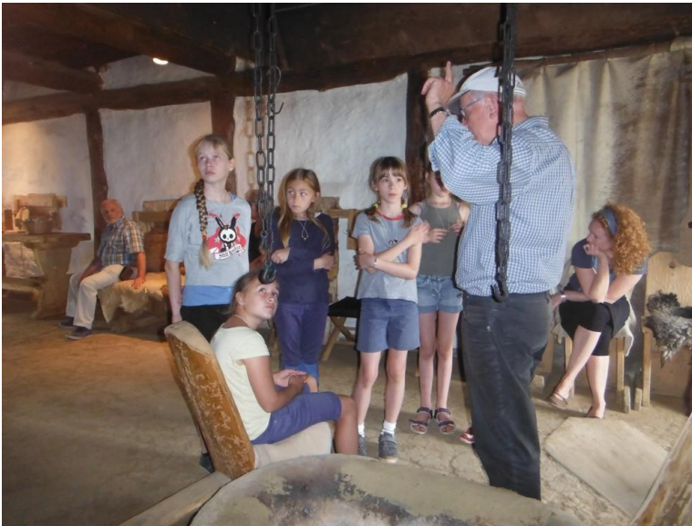
Führung durch das Langhaus